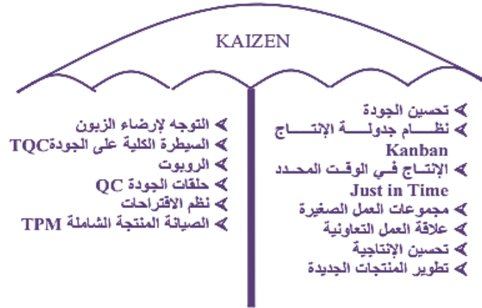
الشكل (1) فلسفة Kaizen في صورة مظلة